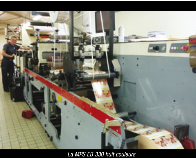
La MPS EB 330 huit couleurs