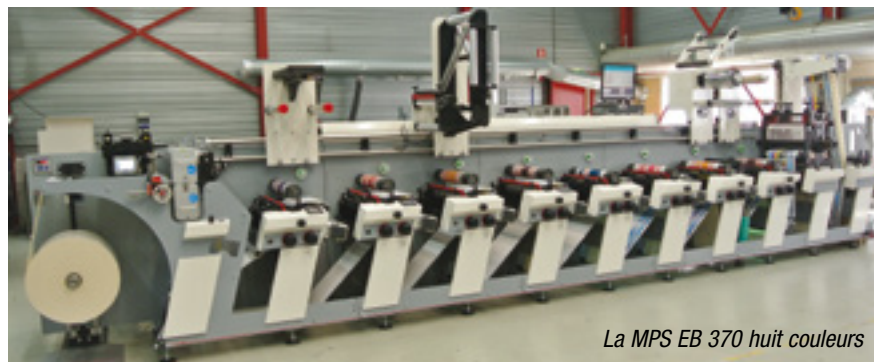
La MPS EB 370 huit couleurs