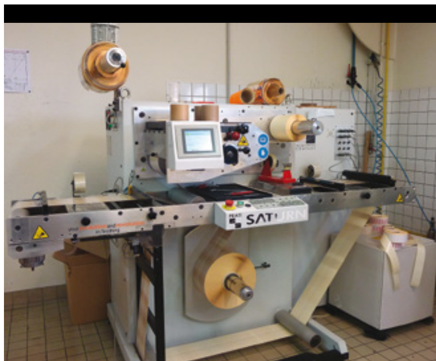
La rembobineuse Saturn de Pradi